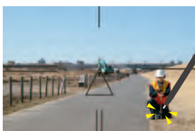
視準したい場所をペンでタップ