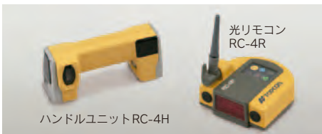
リモートコントロールシステムRC-4