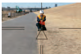
IS3本体が旋回し、自動視準